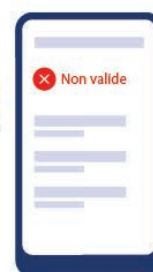
La personne ne peut pas accéder à l'enceinte sportive.

En revanche, si l'application fait apparaître le message suivant :