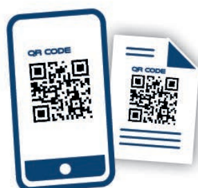
PASS SANITAIRE OU VACCINAL : SUPPORT NUMÉRIQUE OU PAPIER

En cas de raisons sérieuses de penser que le document présenté ne se rattache pas à la personne qui le présente, il est possible de demander à la personne présentant le Pass de justifier de son identité.